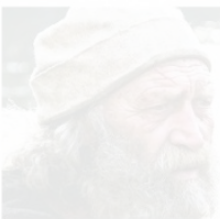
Menocchio (Fasulo) e il vescovo (Gianfranceschi) nel film "L'eretico Menocchio"

Il film "L'eretico Menocchio" di Sergio Castellani è un'opera che esplora la vita di un uomo che sfida il suo tempo. Il film è tratto dal libro di Carlo Ginzburg "Il formaggio e il verme" e racconta la storia di Menocchio, un contadino di Udine che si ribella contro l'ortodossia religiosa e politica del suo tempo.